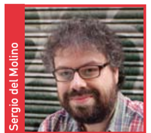
Sergio del Molino

• La vida de Joyce Carol Oates quedó marcada por los dos libros que le regaló su abuela al cumplir nueve años: ‘Alicia en el país de las maravillas’ y ‘Alicia a través del espejo’, ilustrados por John Tenniel. Todo lector cuenta con su propia selección de libros esenciales: aquellos que le han marcado, forjando su carácter o dando, incluso, un vuelco a su vida. Edurne Portela, Sergio del Molino y Sabino Méndez nos contarán cuáles son los suyos y por qué.