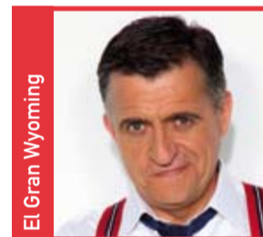
El Gran Wyoming